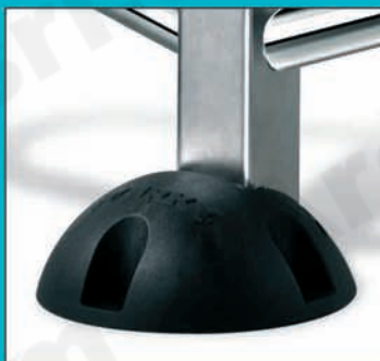
Modelo comunitario registrado Nr. 000025721-0004