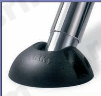
Modelo comunitario registrado Nr. 000025721-0003